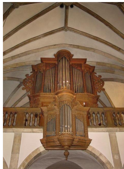
Luxembourg – Eglise Saint-Michel, Orgue Westenfelder (1971; III/28)

Style (au choix): classique français baroque