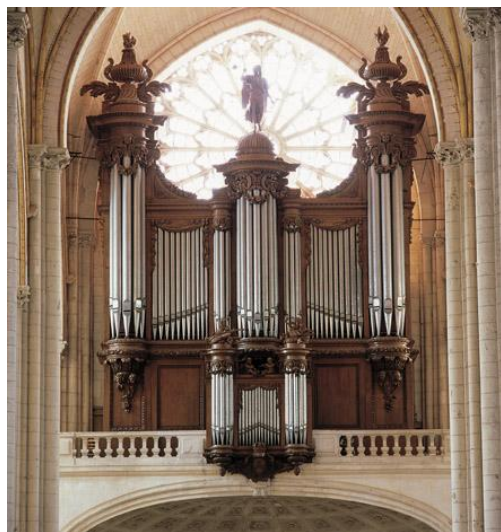
Grand orgue historique François-Henri Clicquot de la Cathédrale Saint-Pierre