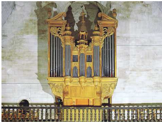
Baugé Maillard 1642, Benoist-Sarelot 1975