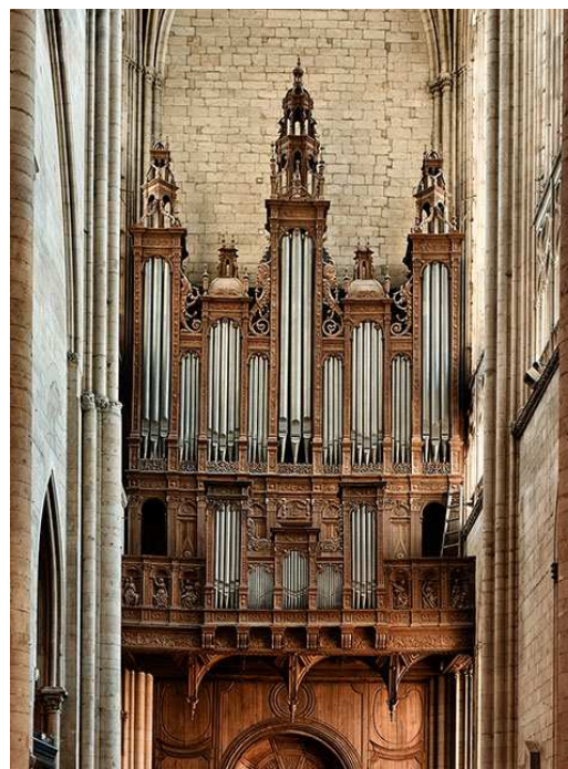
Le Mans Bert 1535, Nonnet-Plet 2018