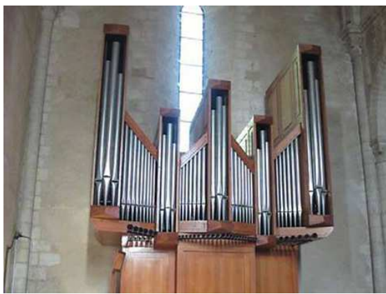
Mareuil-sur-Lay Oberthur 1988