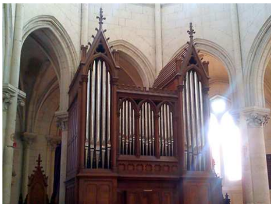
Longué-Jumelles Debierre 1894, Émeriau 1988