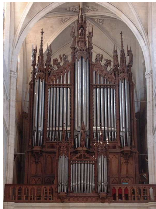
Luçon - Cathédrale Cavaillé-Coll 1855, Schwenkedel 1968