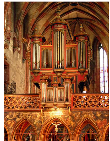
St Pierre le jeune