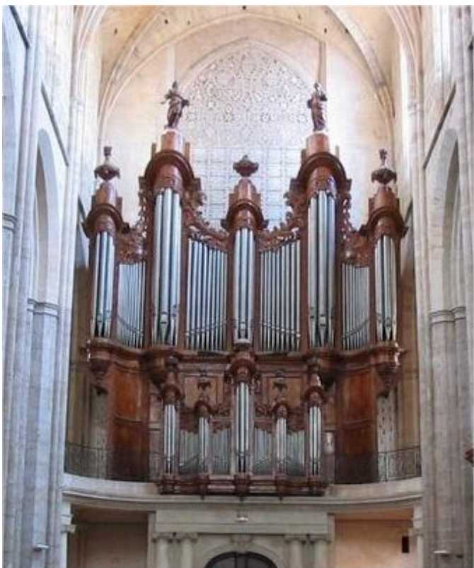
Basilique Sainte-Marie-Madeleine de Saint-Maximin-la-Sainte-Baume - Construit en 1772 par Jean-Espris Isnard, restauration par la manufacture Pascal Quoirin