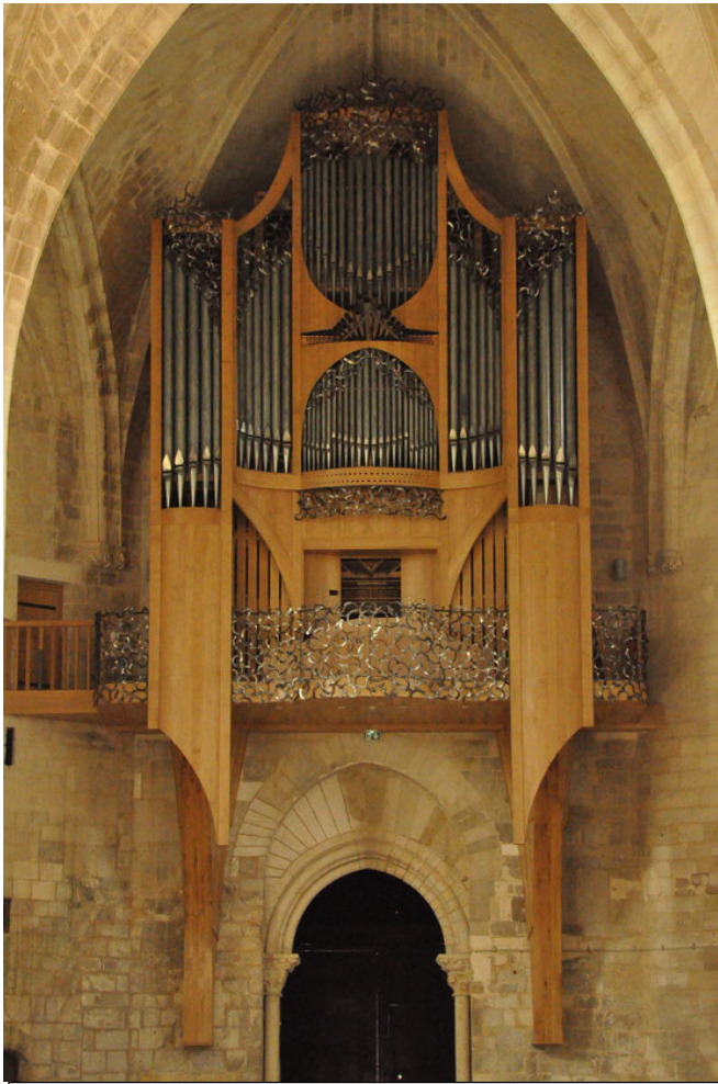
Abbaye de Celles sur Belle - Deux Sèvres Buffet neuf, partie instrumentale provenant d'un orgue de la région parisienne, reconstruction par la manufacture Olivier