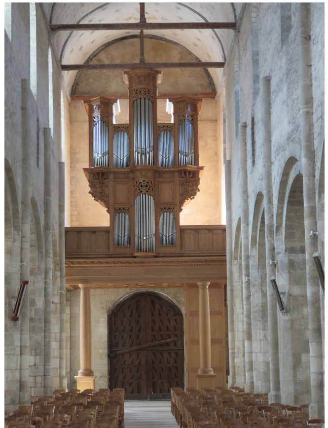
Eglise Saint-Gilles d'Etampes - Essonne Orgue neuf de la manufacture Bertrand Cattiaux