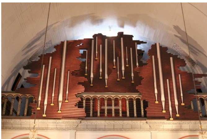
Cathédrale de Basse-Terre de la Guadeloupe. Orgue neuf de la manufacture d'orgue Bertrand Cattiaux