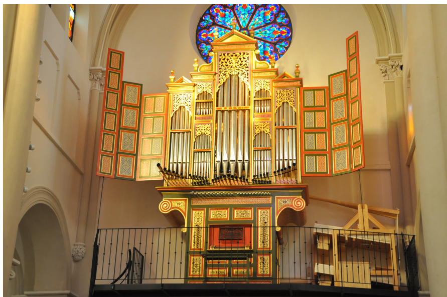
Eglise de Granvillars - Territoire de Belfort Orgue neuf, copie d'orgue espagnol, construit par un binôme d'entreprises espagnoles : Taller de Organeria et Organos Moncayo